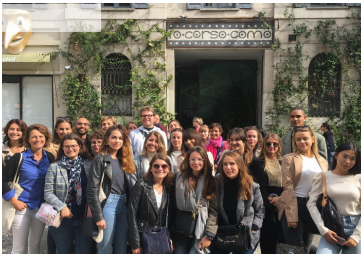
Voyage d'études à Milan - Visite du CORSO COMO